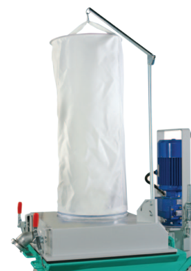
Cuffia per alimentazione da silos (Opzionale)